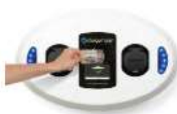
Wallmount TIPO 2 (Doble) Activación tarjeta