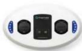
Wallmount TIPO 2 (Doble) Activación llave

Es necesario que el usuario esté autorizado para realizar la recarga y que se pueda vincular a algún tipo de promoción ocasional por parte del cliente.